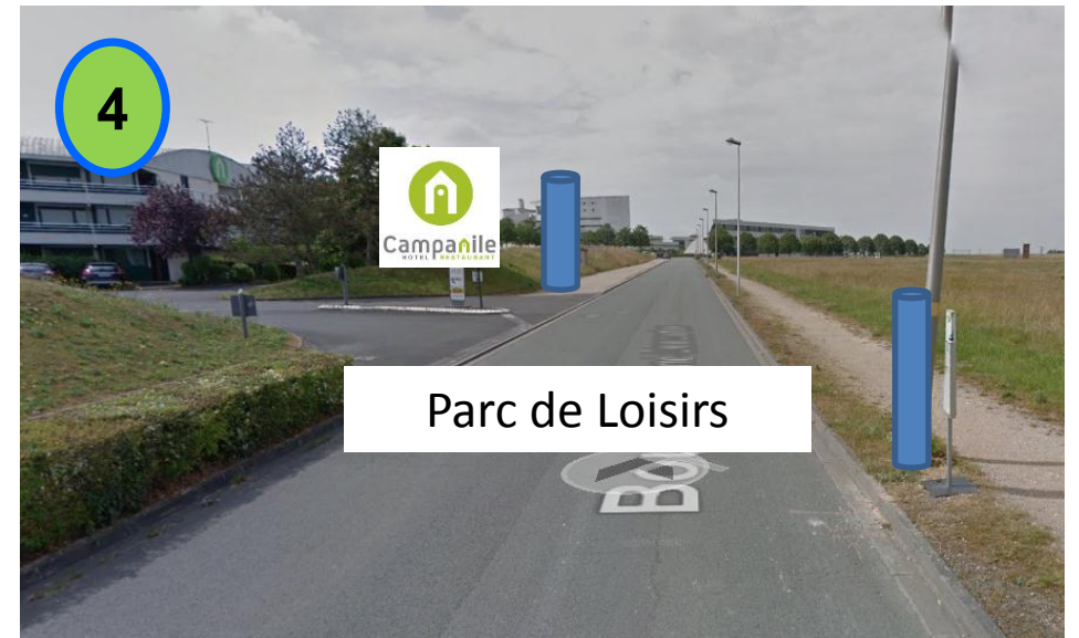
Bd René Descartes (Arrêt Parc de loisirs)