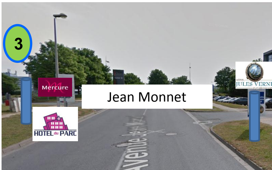
Av Jean Monnet