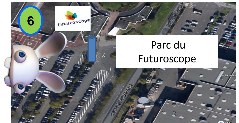
Entrée Caisse du Futuroscope (Arrêt Parc)