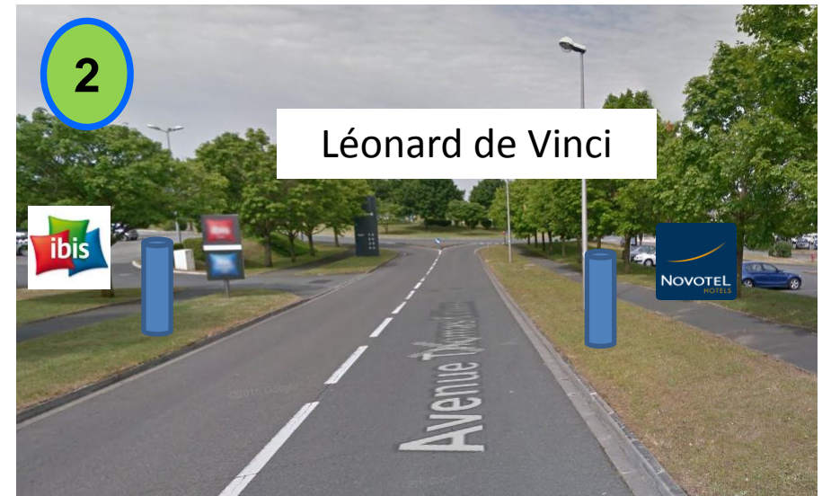
Av Thomas Edison