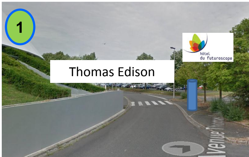
Av Thomas Edison (Entrée Administrative)